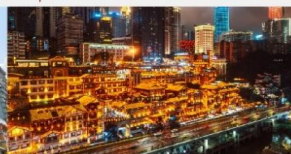
หงหยาดัง(ชมไฟยามค่ำคืน)

*ทางบริษัทฯ ขอสงวนสิทธิ์ในการสลับโปรแกรมทัวร์ตามความเหมาะสมขึ้นอยู่กับสถานการณ์หน้างาน โดยคำนึงถึงผลประโยชน์ของลูกค้าเป็นสำคัญ