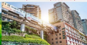
รถไฟฟ้าทะลุถ้ำ