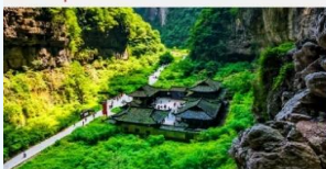
อุทยานแห่งชาติหลุมฟ้า