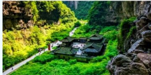
อุทยานแห่งชาติหลุมฟ้า