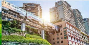
รถไฟฟ้าทะลุถ้ำ