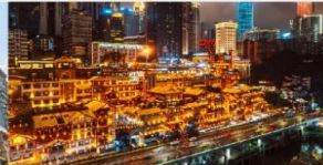
หงหยาดัง(ชมไฟยามค่ำคืน)

*ทางบริษัทฯ ขอสงวนสิทธิ์ในการสลับโปรแกรมทัวร์ตามความเหมาะสมขึ้นอยู่กับสถานการณ์หน้างาน โดยคำนึงถึงผลประโยชน์ของลูกค้าเป็นสำคัญ