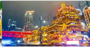
หงหยาดัง(ชมไฟยามค่ำคืน)

*ทางบริษัทฯ ขอสงวนสิทธิ์ในการสลับโปรแกรมทัวร์ตามความเหมาะสมขึ้นอยู่กับสถานการณ์หน้างาน โดยคำนึงถึงผลประโยชน์ของลูกค้าเป็นสำคัญ