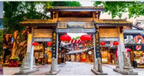
หมู่บ้านโบราณฉือซีโซ่ว