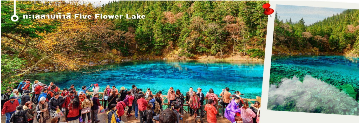
ทะเลสาบห้าสี Five Flower Lake

หนึ่งในจุดที่สวยงามและนักท่องเที่ยวแห่มาเยี่ยมชมเยอะที่สุด ตั้งอยู่ที่ความสูงเหนือระดับน้ำทะเลประมาณ 2,472 เมตร น้ำลึกประมาณ 5 เมตร น้ำใสจนเห็นพื้นด้านล่างของทะเลสาบ สีของผิวน้ำสวยงามแปลกตา โดยเฉพาะเมื่อยามแสงอาทิตย์สาดส่องกระทบผิวน้ำ สีของน้ำในทะเลสาบจะสะท้อนเป็นสีส้มถึง 5 เฉดสี สวยงามสะกดตา ซึ่งสาเหตุที่ทำให้เกิดสีส้มต่างๆ นี้มาจากการสะสมของแร่ธาตุ และพีชน้ำชนิดต่างๆ โดยจะมีสีส้มแตกต่างกันไปตามฤดูกาลและช่วงเวลา ยิ่งถ้ามาในช่วงฤดูหนาว ต้นไม้ริมทะเลสาบจะเต็มไปด้วยหิมะสีขาวตัดกับสีของทะเลสาบ ดูสวยงามแปลกตา