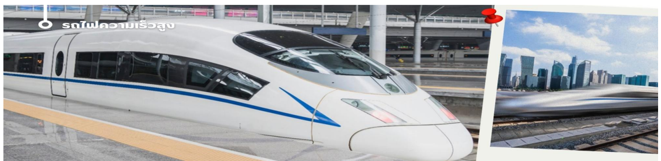
CVZTFU13 เจตุม จิว๋จ้ายโกว หวงหลง ต่ากู่ปิงชวง นั่งรถไฟ 6วัน 5คืน VZ VietjetAir (ไม่ลงร้าน) (Oct'25-Mar'26)

เที่ยง รับประทานเที่ยง ณ ภัตตาคาร (2) จากนั้นนำท่านเดินทางสู่ สถานีรถไฟ เพื่อเดินทางด้วยรถไฟความเร็วสูง เดินทางไปยังสถานีหวงหลงจีว๋จ้าย **รวมบริการรถชกกระเป๋าให้ท่านแล้ว**