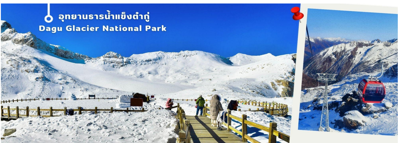
อุทยานธารน้ำแข็งต้ากู่ Dagu Glacier National Park

จากนั้นนำท่านเดินทางสู่ เมืองเฮยลุ่ย (ใช้เวลาเดินทางประมาณ 2 ชั่วโมง)เพื่อเดินทางไปยัง อุทยานธารน้ำแข็งต้ากู่ (รวมกระเช้าขึ้นลง) ต้ากู่ปังชว่น หรือ Dagu Glacier National Park เป็นธารน้ำแข็งกลาเซียร์ที่สวยงามที่สุดแห่ง