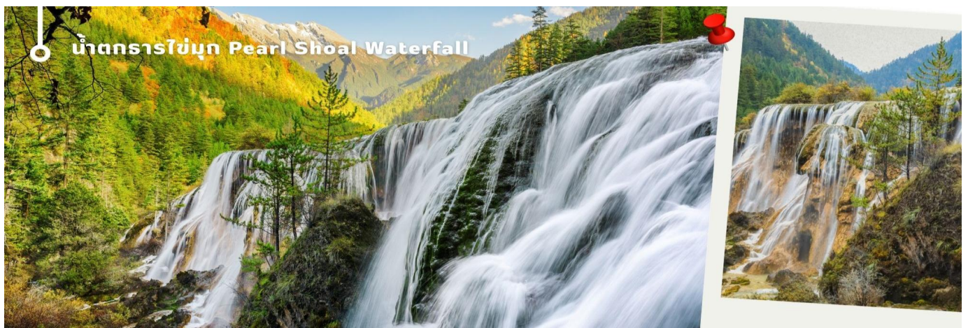
น้ำตกธารไข่มุก Pearl Shoal Waterfall