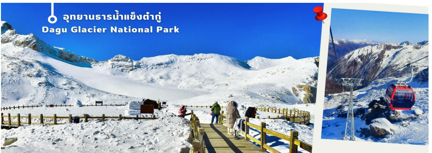
อุทยานธารน้ำแข็งต้ากู่ Dagu Glacier National Park

จากนั้นนำท่านเดินทางสู่ เมืองเฮยลุ่ย (ใช้เวลาเดินทางประมาณ 2 ชั่วโมง)เพื่อเดินทางไปยัง อุทยานธารน้ำแข็งต้ากู่ (รวมกระเช้าขึ้นลง) ต้ากู่ปังชว่น หรือ Dagu Glacier National Park เป็นธารน้ำแข็งกลาเซียร์ที่สวยงามที่สุดแห่ง