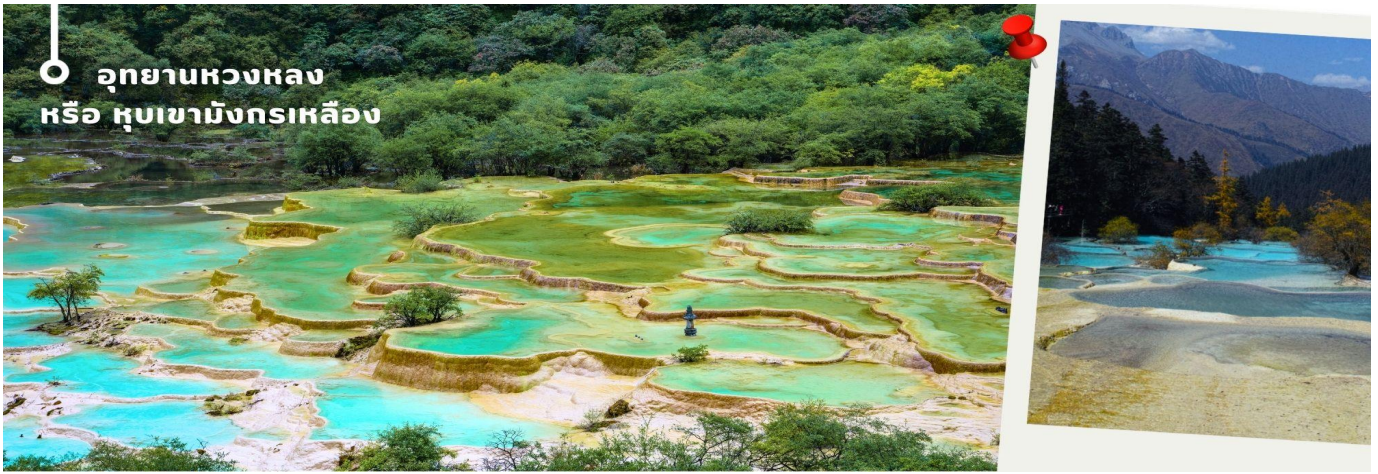
อุทยานหลวง หรือ หุบเขามังกรเหลือง