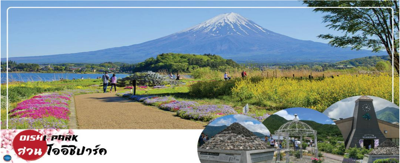
OISHI PARK สวนโออิชิพาร์ค

วันที่สาม จังหวัดยามานาชิ – สวนสาธารณะโออิชิ (ลาเวนเดอร์) – การเรียนพิธีชงชาญี่ปุ่น – จังหวัดคานากาวะ – เกาะเอโนชิมะ – ศาลเจ้าเอโนชิมะ – ถนนเป็นไขเท็นนากามิสะ – เมืองนาริตะ