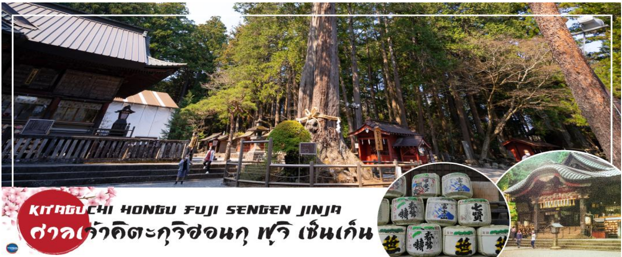
KITAGUCHI HONGU FUJI SENGEN JINJA ศาลเจ้าคิตะกุชิฮงกุ ฟูจิ เซนเกน

นำท่านสักการะ ศาลเจ้าฟูจิโยซิดะเซนเกน (Fujiyoshida Sengen Shrine หรือ Kitaguchi Hongu Fuji Sengen Jinja) เป็นศาลเจ้าเซนเกนหลักที่ตั้งอยู่ทางทิศเหนือของภูเขาไฟฟูจิ ศาลเจ้าฟูจิโยซิดะเซนเกน ตั้งอยู่ในป่าทึบห่างไกลจากถนน จากถนนใหญ่เดินเข้ามาเรียงรายไปด้วยคอมไฟหิน และร่มเงาของป่าไม้สนซีดาร์สูงใหญ่ อาคารต่างๆภายในศาลเจ้าทาด้วยสีแดงตั้งแต่ปี 1615 เดิมทีศาลเจ้าแห่งนี้เป็นจุดเริ่มต้นสำหรับการปีนภูเขาไฟฟูจิจากทางทิศเหนือซึ่งตั้งอยู่ด้านขวาข้างหลังห้องโถงใหญ่ แต่ปัจจุบันนักปีนเขาส่วนใหญ่หันไปเริ่มปีนจาก Fuji Subaru Line สถานีที่ 5