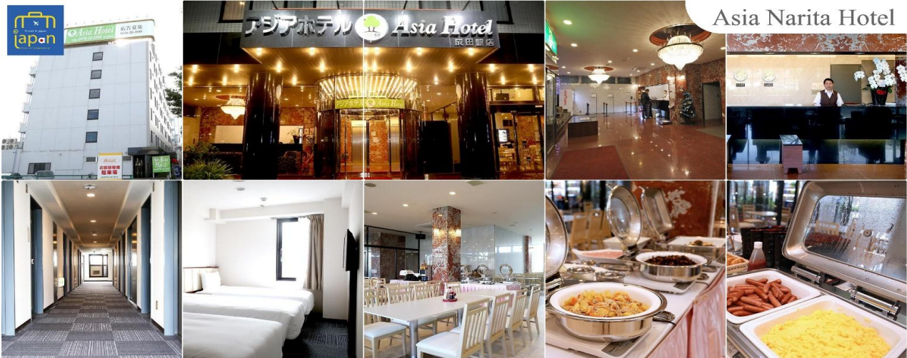
Asia Narita Hotel

พักที่ ASIA HOTEL NARITA หรือเทียบเท่าระดับเดียวกัน