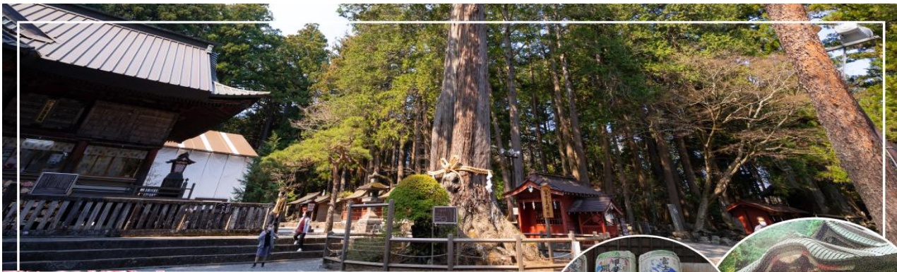
KITAGUCHI HONGU FUJI SENGEN JINJA ศาลเจ้าคิตะกุชิฮอนกุ ฟูจิ เซ็นเก็น

นำท่านสักการะ ศาลเจ้าฟูจิโยซิดะเซนเกน (Fujiyoshida Sengen Shrine หรือ Kitaguchi Hongu Fuji Sengen Jinja) เป็นศาลเจ้าเซนเกนหลักที่ตั้งอยู่ทางทิศเหนือของภูเขาไฟฟูจิ ศาลเจ้าฟูจิโยซิดะเซนเกน ตั้งอยู่ในป่าทึบห่างไกลจากถนน จากถนนใหญ่เดินเข้ามาเรียงรายไปด้วยคอมไฟหิน และร่มเงาของป่าไม้สนซีดาร์สูงใหญ่ อาคารต่างๆภายในศาลเจ้าทาด้วยสีแดงตั้งแต่ปี 1615 เดิมทีศาลเจ้าแห่งนี้เป็นจุดเริ่มต้นสำหรับการปีนภูเขาไฟฟูจิจากทางทิศเหนือซึ่งตั้งอยู่ด้านขวาข้างหลังห้องโถงใหญ่ แต่ปัจจุบันนักปีนเขาส่วนใหญ่หันไปเริ่มปีนจาก Fuji Subaru Line สถานีที่ 5