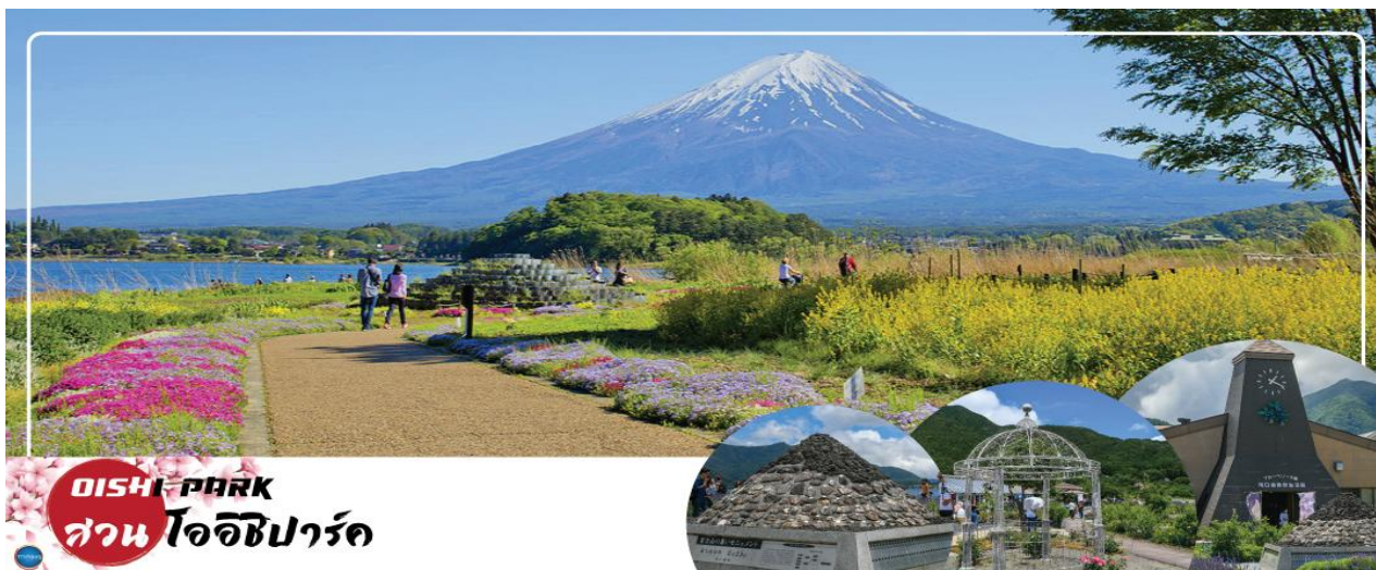
OISHI PARK สวนโออิชิพาร์ค

วันที่สาม จังหวัดยามานาชิ – สวนสาธารณะโออิชิ (ลาเวนเดอร์) – การเรียนพิธีชงชาญี่ปุ่น – จังหวัดคานางาวะ – เกาะเอโนชิมะ – ศาลเจ้าเอโนชิมะ – ถนนเป็นไขเท็นนากามิสะ – เมืองนาริตะ