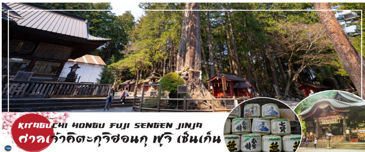
KITAGUCHI HONGU FUJI SENGEN JINJA ศาลเจ้าคิตะกุชิฮงกุ ฟูจิ เซนเก็น

นำท่านสักการะ ศาลเจ้าฟูจิโยซิดะเซนเกน (Fujiyoshida Sengen Shrine หรือ Kitaguchi Hongu Fuji Sengen Jinja) เป็นศาลเจ้าเซนเกนหลักที่ตั้งอยู่ทางทิศเหนือของภูเขาไฟฟูจิ ศาลเจ้าฟูจิโยซิดะเซนเกน ตั้งอยู่ในป่าทึบห่างไกลจากถนน จากถนนใหญ่เดินเข้ามาเรียงรายไปด้วยคอมไฟหิน และร่มเงาของป่าไม้สนซีดาร์สูงใหญ่ อาคารต่างๆภายในศาลเจ้าทาด้วยสีแดงตั้งแต่ปี 1615 เดิมทีศาลเจ้าแห่งนี้เป็นจุดเริ่มต้นสำหรับการปีนภูเขาไฟฟูจิจากทางทิศเหนือซึ่งตั้งอยู่ด้านขวาข้างหลังห้องโถงใหญ่ แต่ปัจจุบันนักปีนเขาส่วนใหญ่หันไปเริ่มปีนจาก Fuji Subaru Line สถานีที่ 5