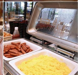
Asia Narita Hotel