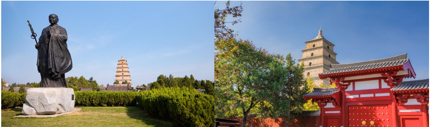
กวางฝิ่นเล่ม

จากนั้นนำท่านเดินทางสู่ เจดีย์ห่านป่าใหญ่ แห่งวัดฉือเอิน สร้างเสร็จในปีค.ศ. 652 โดย ถังเกาจง(หลี่จื้อ) ฮองเต๋องค์ที่สาม แห่งราชวงศ์ถัง และ ได้นิมนต์พระภิกษุสวนจั้ง หรือรู้จักในนามพระถังซัมจั๋ง พระเถระที่มีชื่อเสียงที่สุดในสมัยถัง ซึ่งใช้เวลากว่า 15 ปีจาริกไปถึงอินเดียและได้นำพระธรรมคำสั่งสอนในพระพุทธศาสนา กลับมาเผยแพร่ในแผ่นดินจีนให้มาอยู่ที่วัดฉือเอินแห่งนี้พระถังซัมจั๋งได้ใช้เวลาออกแบบและร่วมสร้างเจดีย์ห่านป่าใหญ่ในวัดฉือเอินเพื่อใช้ในการเก็บรักษาพระไตรปิฎก ที่ท่านได้นำมาจากอินเดียและแปลเป็นภาษาจีนนับจำนวน