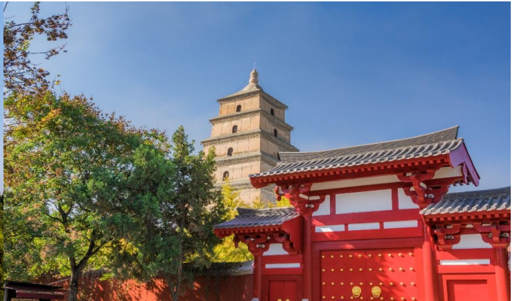
กวางฝิ่นเล่ม

และนำท่านเดินทางไปยัง ถนนต้าถิง แลนด์มาร์คยามค่ำคึกคักที่จำลองบรรยากาศความยิ่งใหญ่ของราชวงศ์ถัง สร้างเป็นถนนคนเดินขนาดใหญ่ มีสถาปัตยกรรมโบราณ ร้านค้า ร้านอาหาร คาเฟ่ และการแสดงแสงสีเสียงที่อลังการ ทำให้ที่นี่กลายเป็นย่านท่องเที่ยวที่คึกคักไม่เคยหลับไหล เป็นศูนย์รวมวัฒนธรรมและการท่องเที่ยวที่ผสมผสานความเก่าแก่กับความทันสมัยได้อย่างลงตัว