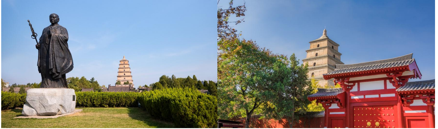
กวางฝิ่นเล็ม

จากนั้นนำท่านเดินทางสู่ เจดีย์ห้าพันปี แห่งวัดฉือเอิน สร้างเสร็จในปีค.ศ. 652 โดย ถังเกาจง(หลี่จื้อ) ฮองเต๋องค์ที่สาม แห่งราชวงศ์ถัง และ ได้นิมนต์พระภิกษุสวนจิ้ง หรือรู้จักในนามพระถังซัมจั๋ง พระเถระที่มีชื่อเสียงที่สุดในสมัยถัง ซึ่งใช้เวลากว่า 15 ปีจาริกไปถึงอินเดียและได้นำพระธรรมคำสั่งสอนในพระพุทธศาสนา กลับมาเผยแพร่ในแผ่นดินจีนให้มาอยู่ที่วัดฉือเอินแห่งนี้พระถังซัมจั๋งได้ใช้เวลาออกแบบและร่วมสร้างเจดีย์ห้าพันปีใหญ่ในวัดฉือเอินเพื่อใช้ในการเก็บรักษาพระไตรปิฎก ที่ท่านได้นำมาจากอินเดียและแปลเป็นภาษาจีนนับจำนวน