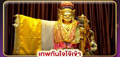
เทพทันใจใจีเข้า