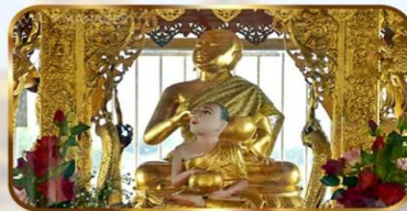
หลวงพ่อพระอุปคุต ปางกบฏระยัยมาร