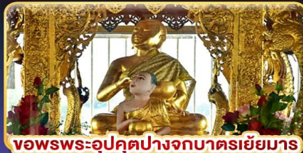
หลวงพ่ออุคุตปางจกบาตริย์मार