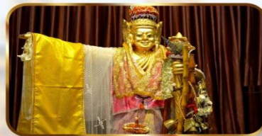
เทพทันใจโจ้เข้า