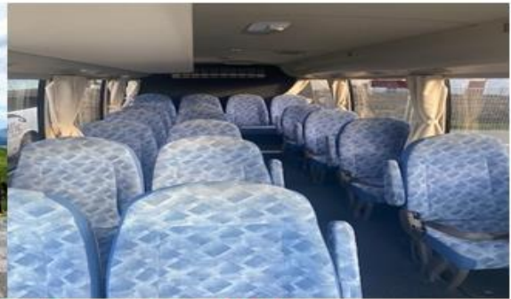
* ลुक้าจำนวน 10 - 14 ท่าน ใช้รถบัสนขนาด 19 - 21 ที่นั่ง*