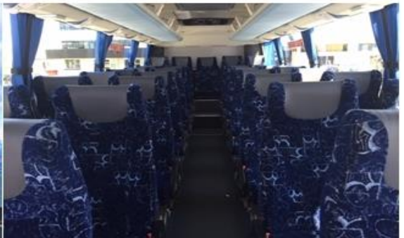
* ลुक้าจำนวน 15 ท่านขึ้นไป ใช้รถบัสนขนาด 30 - 35 ที่นั่ง*