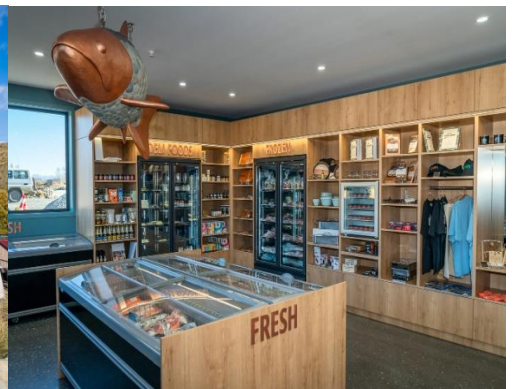
BW HIGHLIGHT NZ North-South 10D 8N JUL-DEC 2026 By QF - อัปเดตที่ 26-3-26