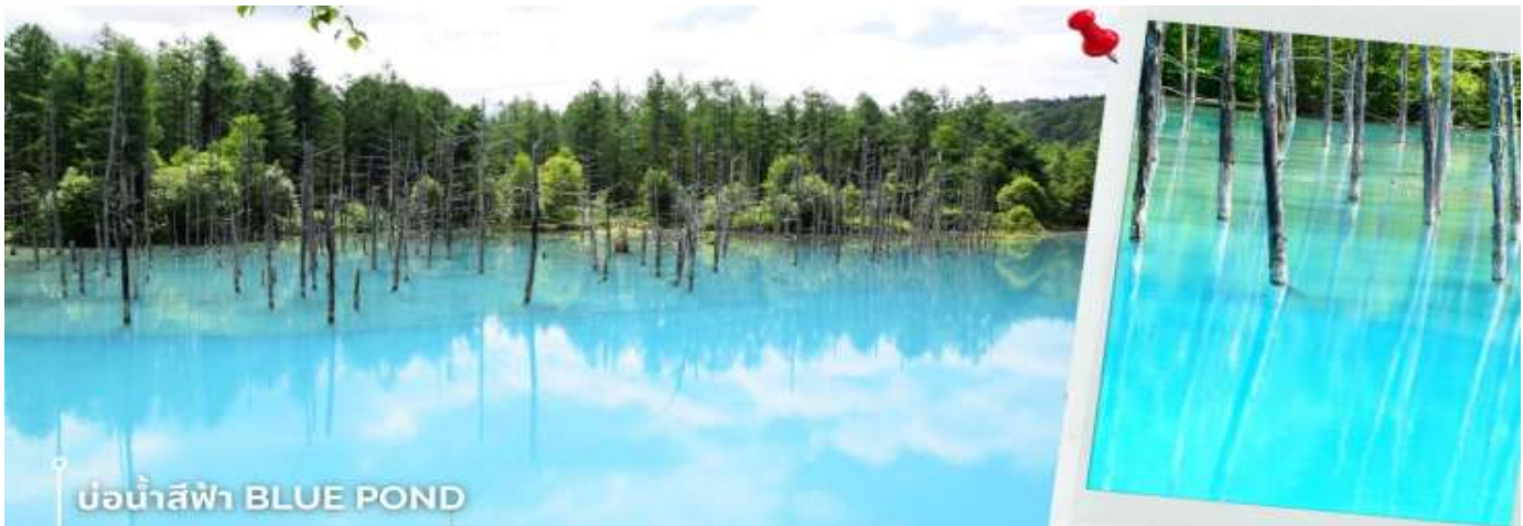
CVZCTS1 ฮอกไกโด อาซาฮิกาว่า ลาวเนเดอร์ ดอกไม้หลากสี 5วัน 3คืน อิสระช้อปปิ้ง 1 วัน บิน VZ (JUL - SEP'26) หน้า 3

07.30 น. เดินทางถึงสนามบินซิดูเสะ ประเทศญี่ปุ่น หลังจากผ่านพิธีตรวจคนเข้าเมืองและศุลกากรแล้ว นำท่านขึ้นรถโค้ชปรับอากาศ พาท่านเดินทางสู่ฮอกไกโด เที่ยง รับประทานอาหารเที่ยง ณ ภัตตาคาร (1) หลังรับประทานอาหาร นำไปยัง เมืองบิเอะ เป็นเมืองที่ได้รับความนิยมทางด้านธรรมชาติแบบทุ่งกว้างและเนินเขา (ใช้เวลาเดินทางรวมประมาณ 2 ชั่วโมง) พาท่านชม บ่อน้ำสีฟ้า Blue Pond ที่ตั้งอยู่ที่เมืองบิเอะ เป็นบ่อน้ำที่กักไว้จากการสร้างเขื่อน สามารถป้องกันความเสียหายที่เกิดขึ้นจากโคลนถล่มบริเวณภูเขาไฟ เป็นบ่อน้ำที่น้ำจะมีสีฟ้าสดกว่าบ่อน้ำทั่วไปจนเป็นเอกลักษณ์ บริเวณบ่อน้ำจะมี ต้นไม้ที่อยู่ในน้ำ ซึ่งคือต้นลาร์ชและซิลเวอร์เบิร์ช และเนื่องจากภายในบ่อน้ำ มีอุณหภูมิเย็นไฮดรอกไซด์ที่เกิดจากการปะทุของภูเขาไฟที่อยู่ใต้น้ำสะท้อนกับแสงแดดที่ส่อง