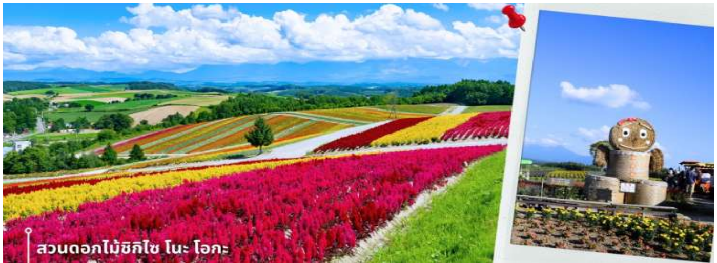
สวนดอกไม้ชิคิไซ โนะ โอะกะ

หลังรับประทานอาหารเช้า นำท่านเดินทางสู่ สวนดอกไม้ชิคิไซ โนะ โอะกะ ชื่อเต็มๆว่า Panoramic Flower Gardens Shikisai No Oka ซึ่งในช่วงซัมเมอร์จะเป็นเนินเขาสีแสนสดใสกว้างสุดสายตา พื้นที่กว่า 15 เฮกตาร์ หรือประมาณ 93 ไร่ เป็นสถานที่ที่ได้ชื่อว่า มีความสวยงามทั้ง 4 ฤดู ที่สวนแห่งนี้จะมีดอกไม้หลากหลายสายพันธุ์ ทั้ง ลาเวนเดอร์ ทิวลิป โคเคีย ทานตะวัน และอื่นๆ มากกว่า 30 ชนิดที่สลับกันไปตามฤดูกาล อย่างในช่วงซัมเมอร์ คือ ช่วงเวลาที่ บรรดาดอกไม้และพืชพันธุ์จะบานสะพรั่งสุดสายตา พร้อมกับบรรยากาศอันสดใสรวมถึงกิจกรรมกลางแจ้งที่ให้คุณเพลิดเพลิน โดยแต่ละช่วงเวลาจะมีดอกไม้ประจำฤดูกาลบานต้อนรับในบรรยากาศสดชื่น และยังมีทิวเขาที่งดงามเป็นเหมือนฉากหลัง ให้ท่านได้อิสระเดินชมความสวยงามและเก็บภาพความประทับใจ