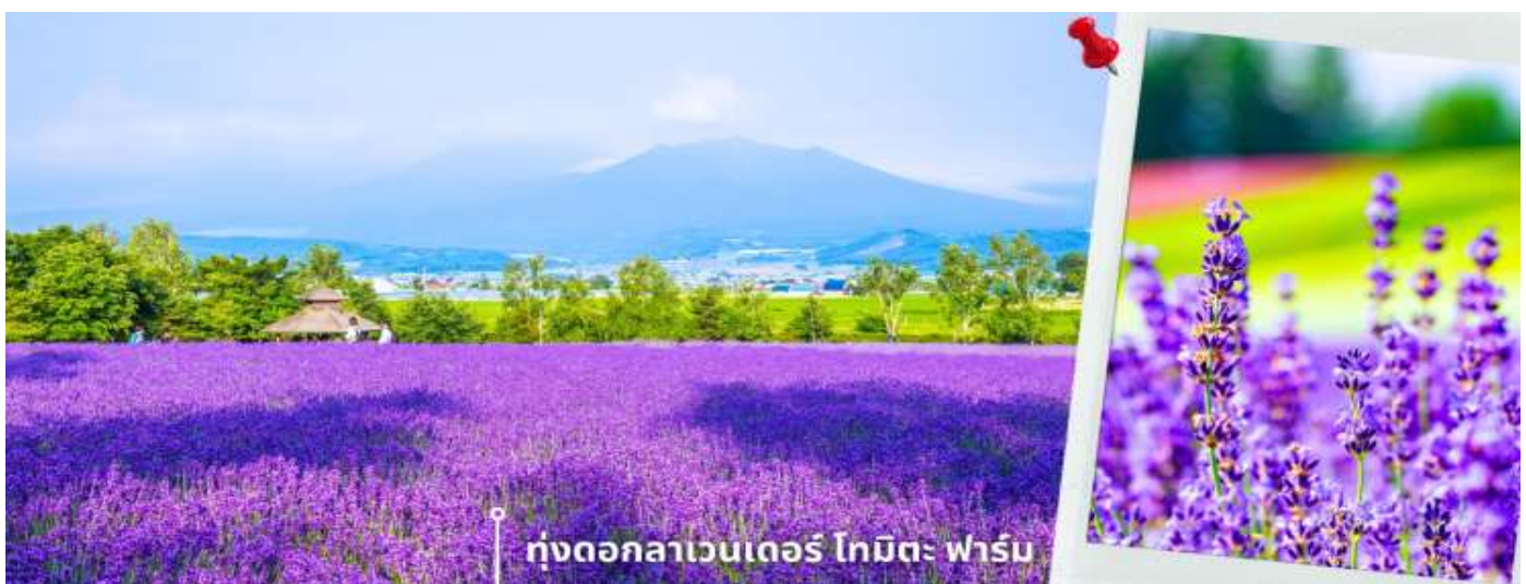
ฟุงดอกลาเวนเดอร์ โทมิตะ ฟาร์ม

จากนั้นนำท่านเดินทางสู่ ฟุงดอกลาเวนเดอร์ โทมิตะ ฟาร์ม ตั้งอยู่ในเมืองฟูราโนะ จังหวัดฮอกไกโด เป็นแหล่งชม ฟุงลาเวนเดอร์ที่มีชื่อเสียงและได้รับความนิยมมากที่สุดแห่งหนึ่งของญี่ปุ่น ในช่วงฤดูร้อน ฟุงลาเวนเดอร์จะผลิบานเรียงรายเป็นผืนกว้าง สีม่วงสดใสตัดกับท้องฟ้าและธรรมชาติรอบด้าน สร้างทัศนียภาพที่สวยงามและเป็นเอกลักษณ์ ภายในฟาร์มมีการจัดพื้นที่อย่างเป็นระเบียบ ให้ท่านสามารถเดินชมดอกไม้ ถ่ายภาพ และเพลิดเพลินกับบรรยากาศ นอกจากนี้ยังมีร้านจำหน่ายผลิตภัณฑ์จากลาเวนเดอร์ เช่น ของที่ระลึก ขนม เครื่องดื่ม ให้ท่านได้อิสระตามอัธยาศัย