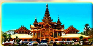
พระราชวังบุเรงนอง

โรงแรม เมืองย่างกุ้ง หรือเทียบเท่า 5 ดาว