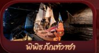
พิพิธภัณฑ์ทิวาชา