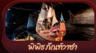
พิพิธภัณฑ์ทิวาชา