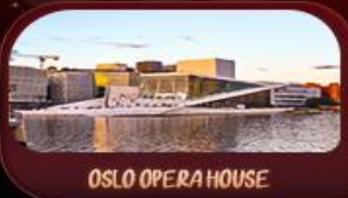
OSLO OPERA HOUSE

รหัสโปรแกรม : SEK156 95 วัน 6 คืน | เช่าสต็อกโฮล์ม-ออกโคเปนเฮเกน