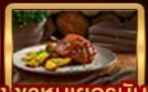
Ribs of Vienna, ปลาเทราศย่าง, ขาหมูเยอรมัน

ตะลุยกินดีสุดของเขายุโรป "Top of Germany" เยือนเมืองออสเตรีย จัตุรัสมาเรียนพลาซซ์ สัมผัสเมืองมรดกโลก เซสท์ ครุมลอฟ เยี่ยมชมปราสาทปราก ย้อนรอยอดีตชาลส์บูร์ก สวนมิราเบล บ้านเกิดของโมสาร์ท ปราสาทราติสลาวา มหาวิทยาลัยคาร์ลสบูร์ก สุดโรแมนติกสองเรือชมความงามแม่น้ำดานูบ จัตุรัสวีนา พระราชวังฮอฟบวร์ก ขึ้นตากับความป่าหลงใหลของ หมู่บ้านริมทะเลสาบฮัลล์สตัดท์ พระราชวังเซนต์มาร์ติน ปิดท้ายช้อปปิ้งจุใจ