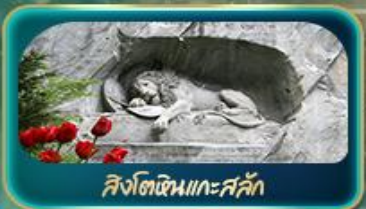
สิงโตหินแกะสลัก