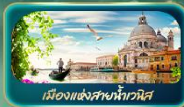
เมืองแห่งสายน้ำเวนิส

จุดบรรจบความอลังการของธรรมชาติ Dolomites และ ทะเลสาบมิซูรีน่า ชมน้ำสีเทอร์ควอยซ์ ทะเลสาบเบรียส สูดโรแมนติกเมืองแห่งสายน้ำเวนิส ห้ามพลาด มหาวิหารดูโอโมแห่งมิลาน โรมัน อารีน่า บ้านของจูเลียต เที่ยวลิวซ์ริ่น ชมสิงโตหินแกะสลัก เดินเล่นสะพานไม้ชาเปล อินส์บรุค ย้อนอดีตกับเสาชนต์แอนน์ หลังคาทองคำ ช้อปปิ้ง Outlet