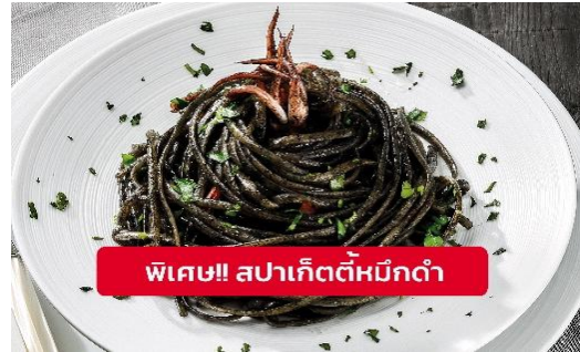
พิเศษ! สปาเก็ตตี้หมึกดำ

Highlight! เมื่อเยือนเกาะเวนิส เมนูที่ขึ้นชื่อและหากได้มาต้องได้ลิ้มลอง สปาเก็ตตี้ผัดซอสหมึกดำที่คลุกเคล้ากับความหอมนุ่มนวลกับบรรยากาศ