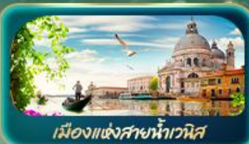
เมืองแห่งสายน้ำเวนิส

จุดบรรจบความอลังการของธรรมชาติ Dolomites และ ทะเลสาบมิซูริน่า ชมน้ำสีเทอร์ควอยซ์ ทะเลสาบเบรียส สูดโรแมนติกเมืองแห่งสายน้ำเวนิส ห้ามพลาด มหาวิหารดูโอโมแห่งมิลาน โรมัน อารีน่า บ้านของจูเลียต เที่ยวลิวซ์ริ่น ชมสิงโตหินแกะสลัก เดินเล่นสะพานไม้ชาเปล อินส์บรุค ย้อนอดีตกับเสาชนต์แอนน์ หลังคาทองคำ ซ็อปจุไร Outlet