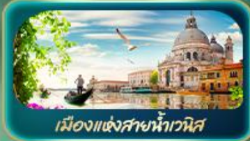
เมืองแห่งสายน้ำเวนิส

จุดบรรจบความอลังการของธรรมชาติ Dolomites และ ทะเลสาบมิซูริน่า ชม น้ำสีเทอร์ควอยซ์ ทะเลสาบเบรียส สูดโรแมนติกเมืองแห่งสายน้ำไวส ห้ามพลาด มหาวิหารดูโอโมแห่งมิลาน โรมัน อารีน่า บ้านของจูเลียต เที่ยวลูเซิร์น ชมสิงโตหินแกะสลัก เดินเล่นสะพานไม้อาเปลา อินส์บรุค ย้อนอดีตกับเสาชนต์แอนน์ หลังคาทองคำ ซ็อบปูจิว Outlet