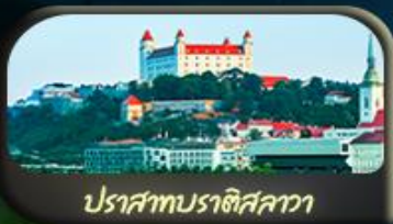
ปราสาทราชอิสลาวา

02-09 เม.ย. 69 / 03-10 เม.ย. 69 08-15 เม.ย. 69 / 10-17 เม.ย. 69 28 เม.ย. - 05 พ.ค. 69