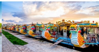
ล่องเรือมังกร