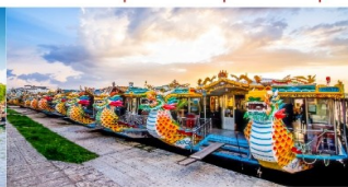
ล่องเรือมังกร