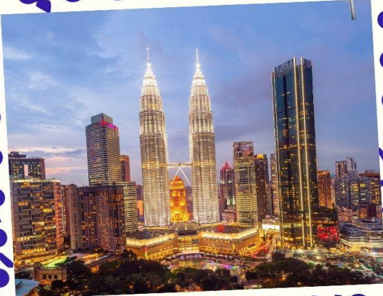
Petronas Twin Towers