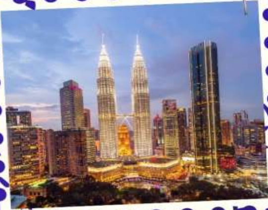
Petronas Twin Towers