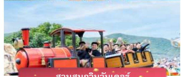
สวนสนุกวินวันเดอร์