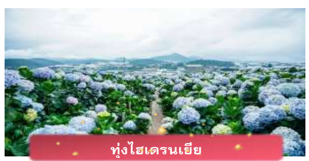
ทุ่งไฮเดรนเยีย

เที่ยง บริการอาหารกลางวัน ณ ภัตตาคาร นำท่านเล่น นั่งโรลเลอร์โคสเตอร์ ชมธรรมชาติท่ามกลางป่าสนไปยัง น้ำตกตาดันลา สัมผัสอากาศบริสุทธิ์และบรรยากาศสดชื่น พร้อมจิบเครื่องดื่มชม วิถีธรรมชาติ นำท่านเดินทางสู่ ทุ่งไฮเดรนเยีย อีกหนึ่งทุ่งดอกไม้ ที่ไม่ควรพลาดมาถ่ายรูปกัน ข้อดีของที่นี่ คือ ดอกไม้จะบานตลอดทั้งปี