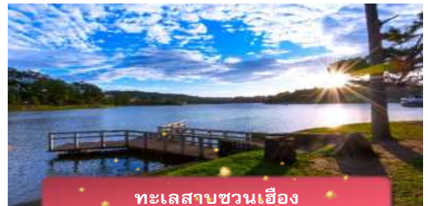
ทะเลสาบชวนเอียง

ที่พัก The Western Hill ระดับ 4 ดาวหรือเทียบเท่า