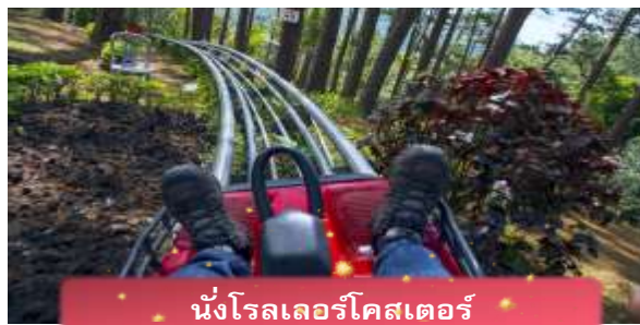
นั่งโรลเลอร์โคสเตอร์