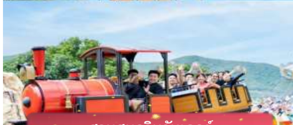
สวนสนุกวินวันเดอร์