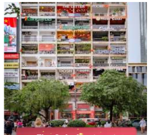
The Cafe Apartment.