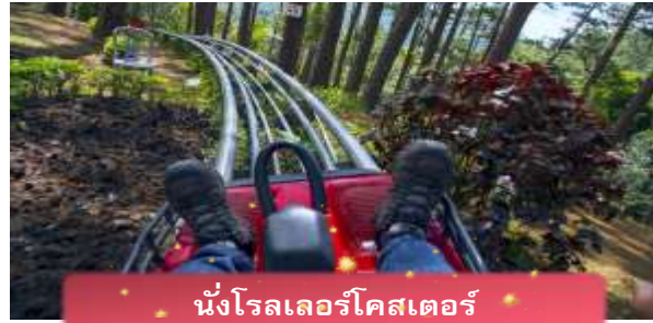
นั่งโรลเลอร์โคสเตอร์