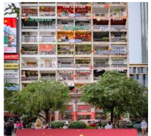
The Cafe Apartment.

ที่พัก Sai Gon Emerald ระดับ 4 ดาวท้องถิ่นหรือเทียบเท่า