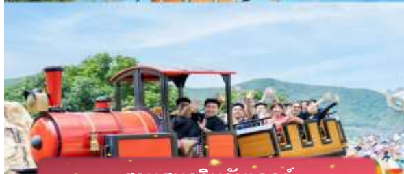
สวนสนุกวินวันเดอร์