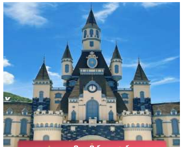
เกาะวินเพิร์ลแลนด์

เที่ยง บริการอาหารกลางวัน ณ ภัตตาคาร พิเศษ ... เมนูบุฟเฟ่ต์บนเกาะ