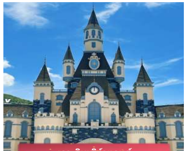
เกาะวินเพิร์ลแลนด์

เที่ยง บริการอาหารกลางวัน ณ ภัตตาคาร พิเศษ ... เมนูบุฟเฟต์บนเกาะ