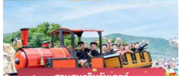
สวนสนุกวินวันเดอร์