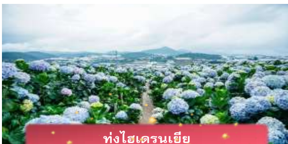
ทุ่งไฮเดรนเยีย

นำท่านเล่น นั่งโรลเลอร์โคสเตอร์ ชมธรรมชาติท่ามกลางป่าสนไปยัง น้ำตกดาตันลา สัมผัสอากาศบริสุทธิ์และบรรยากาศสดชื่น พร้อมจิบเครื่องดื่มชม วิวธรรมชาติ นำท่านเดินทางสู่ ทุ่งไฮเดรนเยีย อีกหนึ่งทุ่งดอกไม้ ที่ไม่ควรพลาดมาถ่ายรูปกัน ข้อดีของที่นี่ คือ ดอกไม้จะบานตลอดทั้งปี