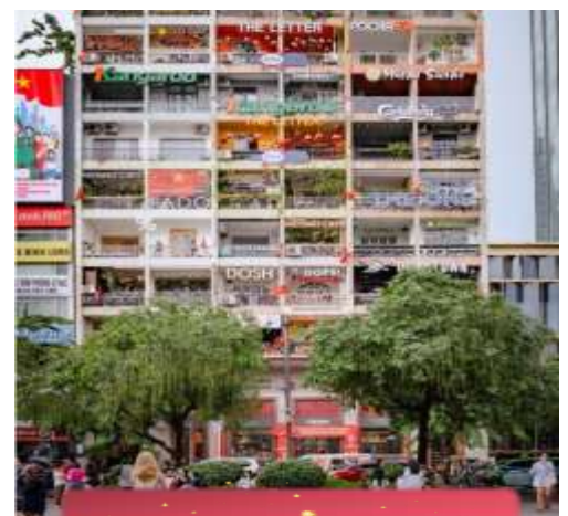
The Cafe Apartment.

ที่พัก Sai Gon Emerald ระดับ 4 ดาวท้องถิ่นหรือเทียบเท่า