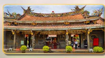
วัดต้าหลงตงเป่าอัน