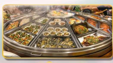
หม้อนึ่งจักรพรรดิ