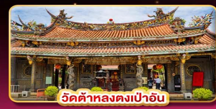
วัดต้าหลงตงเป่าอัน