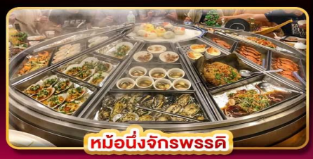
หม้อนึ่งจักรพรรดิ

แพคเกจรวมตั๋วเครื่องบิน บินคุ้ม เที่ยวครบ เช็กอินทุกจุดไฮไลต์