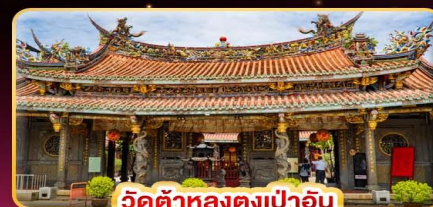
วัดต้าหลงตงเป่าอัน