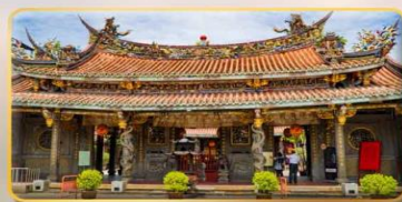
วัดต้าหลงตงเป่าอัน