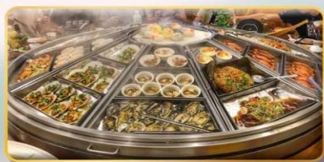
หม้อนึ่งจักรพรรดิ