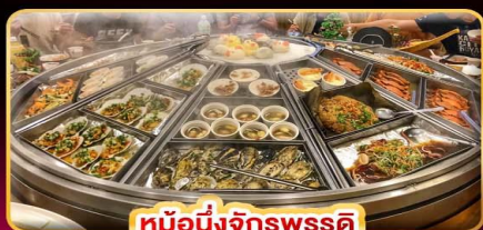
หม้อนึ่งจักรพรรดิ

กล่องโดมคอกแห้งทางรถไฟผิงซี บินคุ้ม เที่ยวครบ เช็किनทุกจุดไฮไลท์