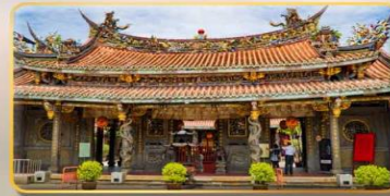
วัดต้าหลงตงเป่าอัน