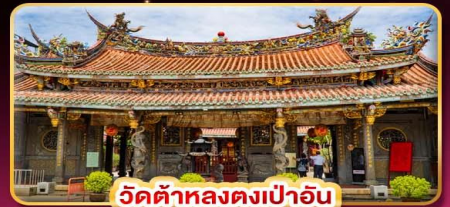
วัดต้าหลงตงเป่าอัน