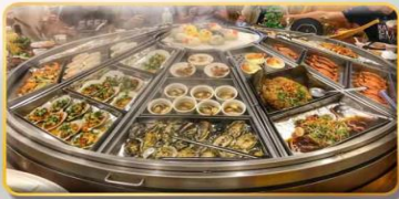
หม้อไฟจันทรพรรดิ