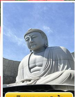
เป็นพระพุทธรเจ้า