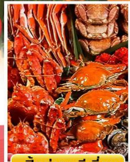
ปิ้งย่างพรีเมียม

🍽️ ออนเซ็น 2 คั้น 🧳 นน.กระเป๋า 23 กก. ☀️ 6Days 4Night