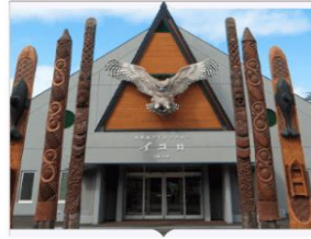
หมู่บ้านไอนุโดตัน