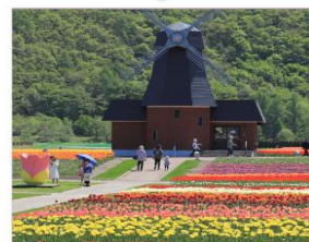
ดามิยูเม็ทสึ(ทิวลิป)