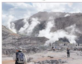
ปล่องภูเขาไฟอิโอะ