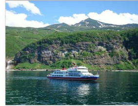
ล่องเรือแหลมชิเรโตโกะ