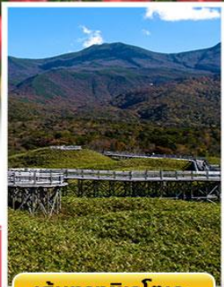
เส้นทางชิเรโตเกะ