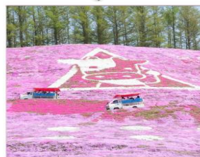
ฮิกาชิโมโกโตะ(พื้งมอส)