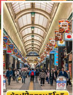
ช้อปปิ้งทานุกิโคจิ