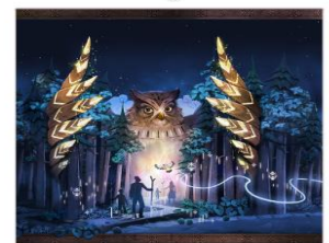
kamui lumina night