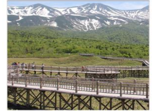
ทะเลสาบทั้ง5ชิเรโตโกะ