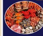
ซาบุสโตลญี่ปุ่น

ปิ้งย่างพรีเมียม ทะเลและเนื้อคุณภาพ ร้านต้นตะ