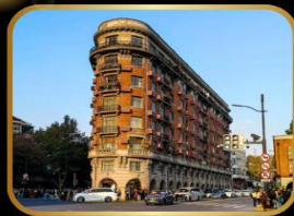
ถ่ายรูปจุดเช็คอิน WUKANG MANSION