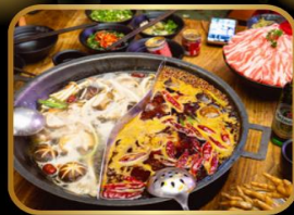
พิเศษ! เมนูหม้อไฟ สุกี้ หม้อไฟสไตล์จีน