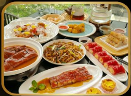
อาหารระดับ มิชลิน TAO TAO JU