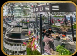
ภัตตาคารชื่อดัง WAREHOUSE NO.3