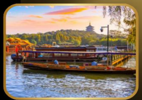
ล่องเรือ ทะเลสาบซีหู