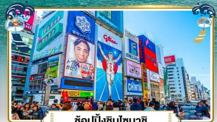
ซ้อปิ้งชินโซบาชิ