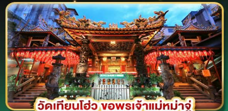
วัดเทียนโฮ่ว จอพระเจ้าแม่หม่าจู