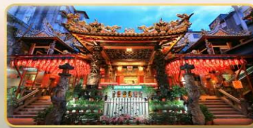
วัดเทียนโฮ่ว จอพริเจ้าแม่หม่าจู