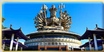
วัดกวนอิมหยวนเต้า