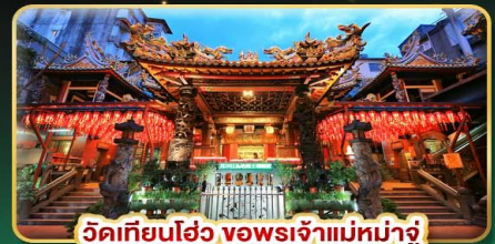
วัดเทียนโฮ่ว จอพระเจ้าแม่หม่าจู