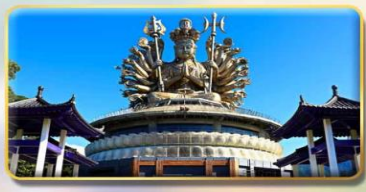
วัดกวนอิมหยวนเต้า