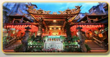
วัดเทียนโฮ่ว จอพริเจ้าแม่หม่าจู