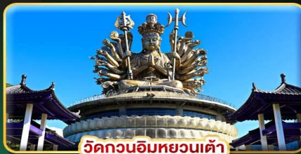
วัดกวนอิมหยวนเต้า