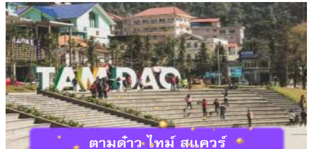
ตามด้าว ไทม์ สแควร์

ที่พัก A25 LUXURY HOTEL ระดับ 4 ดาวมาตรฐานห้องถิ่น หรือเทียบเท่า