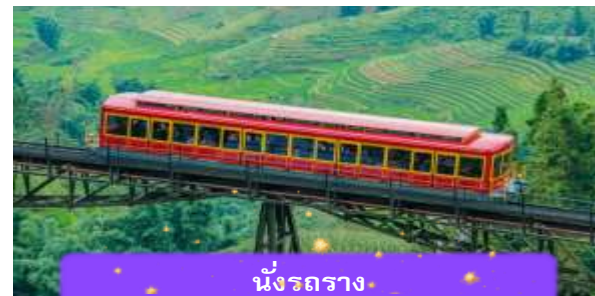
นั่งรถราง

เที่ยง บริการอาหารกลางวัน ณ ภัตตาคาร พิเศษ ... เมนูบุฟเฟต์ฟานซิปัน