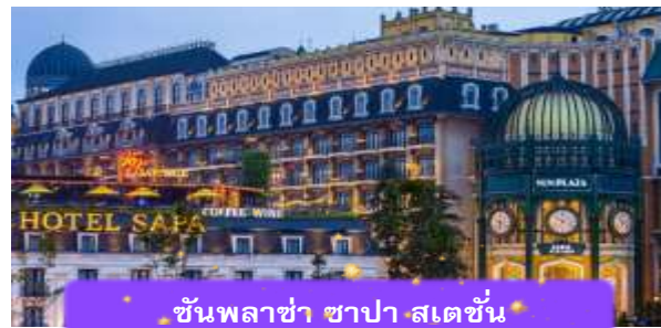
ชั้นพลาซ่า ซาปา สเตชั่น