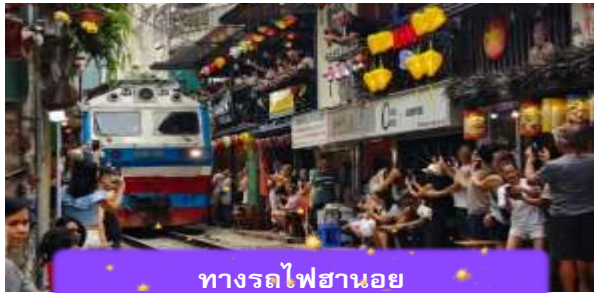
ทางรถไฟฮานอย

เช้า บริการอาหารเช้า ณ ห้องอาหารของโรงแรม หลังจากนั้นนำท่านเดินทางสู่ ทางรถไฟฮานอย เป็นแหล่งท่องเที่ยวที่ได้รับความนิยม ในกรุงฮานอย ประเทศเวียดนาม. จุดเด่นของที่นี่คือทางรถไฟที่วิ่งผ่านย่านชุมชนที่อยู่ อาศัย ทำให้เกิดภาพวิถีชีวิตที่แปลกตาและเป็นเอกลักษณ์ ท่านสามารถทดลองชิม กาแฟต่างๆจากเวียดนามได้ที่นี้ อาทิ กาแฟนมเวียดนามที่มีความเข้มข้น กาแฟไข นุ่มนวลหอมละมุน หรือกาแฟเกลือที่ทำให้ความรู้สึกแปลกแต่อร่อยอย่างบอกไม่ถูก (ไม่ รวมค่าเครื่องดื่ม)