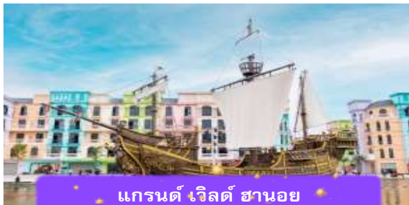
แกรนด์ เวิลด์ ฮานอย

นำท่านเช็คอิน แกรนด์ เวิลด์ ฮานอย แลนด์มาร์คใหม่ที่กำลังมาแรงในฮานอย แหล่งรวมไลฟ์สไตล์ การช้อปปิ้ง ศิลปะ และความบันเทิงแบบครบวงจร ด้วยสถาปัตยกรรมที่ทันสมัยและการตกแต่งสไตล์ยุโรป ทำให้ที่นี่กลายเป็นจุดถ่ายรูปยอดนิยม ทั้งกลางวันและกลางคืน เหมาะสำหรับนักท่องเที่ยวสายถ่ายรูป ช้อปปิ้ง และคนที่อยากสัมผัสสีสันของฮานอยที่มีความร่วมสมัย เย็น บริการอาหารค่ำ ณ ภัตตาคาร