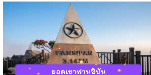
ยอดเขาฟานซิปัน