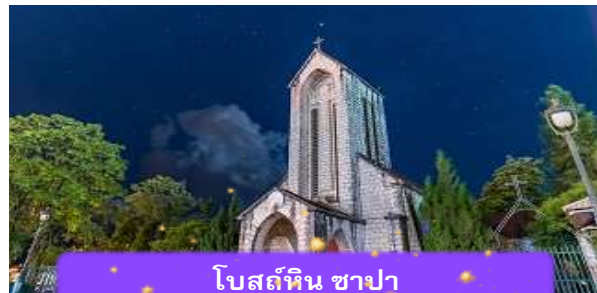
โบสถ์หิน ซาปา