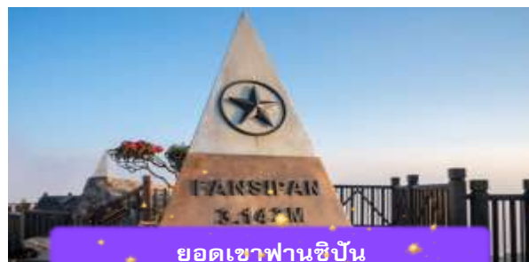
ยอดเขาฟานซิปัน