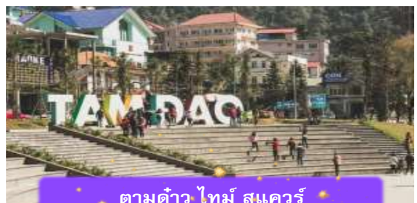
ตามด้าว ไทม์ สแควร์

ที่พัก A25 LUXURY HOTEL ระดับ 4 ดาวมาตรฐานห้องถิ่น หรือเทียบเท่า