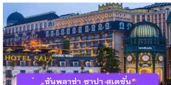
ชั้นพลาซ่า ซาปา สเตชั่น