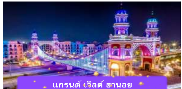
แกรนด์ เวิลด์ ฮานอย

ได้เวลาอันสมควรนำท่านเดินทางเข้าสู่ สนามบินฮานอย เพื่อเดินทางกลับประเทศไทย (ใช้เวลาเดินทางประมาณ 1 ชั่วโมง) 23.20 นำท่านเดินทางสู่ สนามบินสุวรรณภูมิ ประเทศไทย เที่ยวบินที่ ET609 (บริหารอาหารว่าง และเครื่องดื่มบนเครื่อง) 00.50 เดินทางถึง สนามบินสุวรรณภูมิ ประเทศไทย โดยสวัสดิภาพ ... พร้อมความประทับใจ