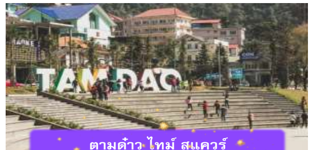
ตามด้าว ไทม์ สแควร์

เช็คอิน ตามด้าว ไทม์ สแควร์ ที่นี่เป็นฟิลสวอนสาธารณะกลางเมือง เป็นพื้นที่ที่ชาวตามด้าวใช้พักผ่อนกันเป็นลานน้ำพุกว้าง ๆ ที่มองเห็นเมืองโดยรอบ ซึ่งรอบๆจัตุรัสนี้ก็จะมีย่านค้า คาเฟ่ ร้านอาหาร และมีมุมถ่ายรูปน่ารักๆ เหมาะสำหรับการถ่ายรูป นำท่านเดินทางกลับ เมืองฮานอย