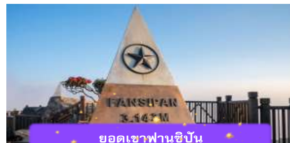
ยอดเขาฟานซิปัน