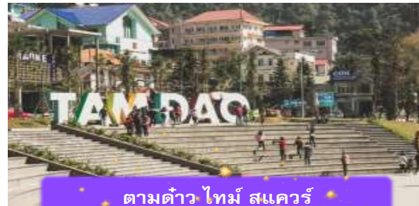
ตามด้าว ไทม์ สแควร์

ที่พัก A25 LUXURY HOTEL ระดับ 4 ดาวมาตรฐานห้องถิ่น หรือเทียบเท่า