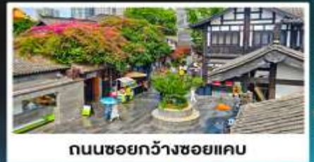
ถนนชอยกว้างชอยแคว