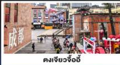
ตงเจียวจื้ออี้