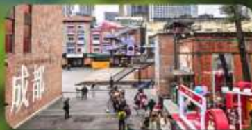
ดงเจียวจ้ออ๋