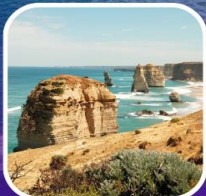
Great Ocean Road (ครึ่งสาย)