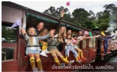
บึงรถไฟวิคตอเรีย, เมลเบิร์น