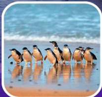
เพนกวินที่เกาะฟิลลิป