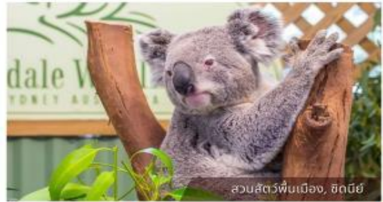
สวนสัตว์พืชมเมือง, ซิดนีย์