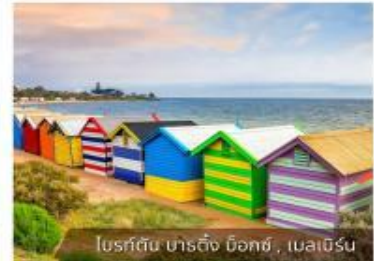
โบสถ์สีรุ้ง, บิชอปส์, เมลเบิร์น