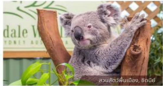
สวนสัตว์พื้นเมือง, ซิดนีย์