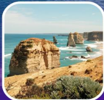
Great Ocean Road (ครึ่งสาย)