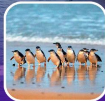
เพนกวินที่เกาะฟิลลิป