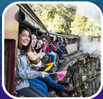
รถไฟจักรไอน้ำที่โบราณ