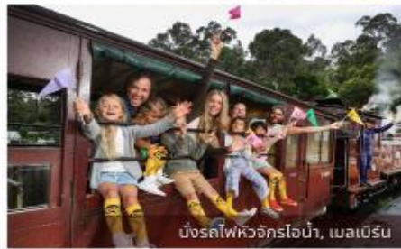
บิงกริลไฟว์จักรไอน้ำ, เมลเบิร์น